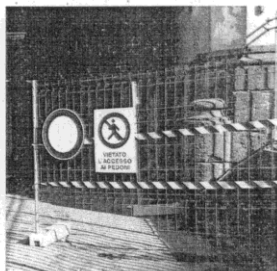
CHIUSA VIA DEL CASTELLO

Smog, suono di clacson, rumore di automobili che assano in continuazione -dice il commerciante- ci fanno rendendo la vita impossibile, senza tenere conto del danno stiamo registrando nelle vendite". Non che le strade non andassero chiuse" tiene a sottolineare. "Perché -continua- la tutela dell'incolumità dei passanti viene prima di tutto, ma dopo avere chiusa la strada appena sono caduti i primi calcinacci non c'è stata la medesima rapidità a mettere in atto i necessari interventi riparativi definitivi