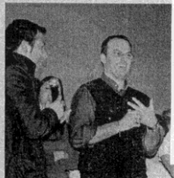
UN MOMENTO DELLA SERATA