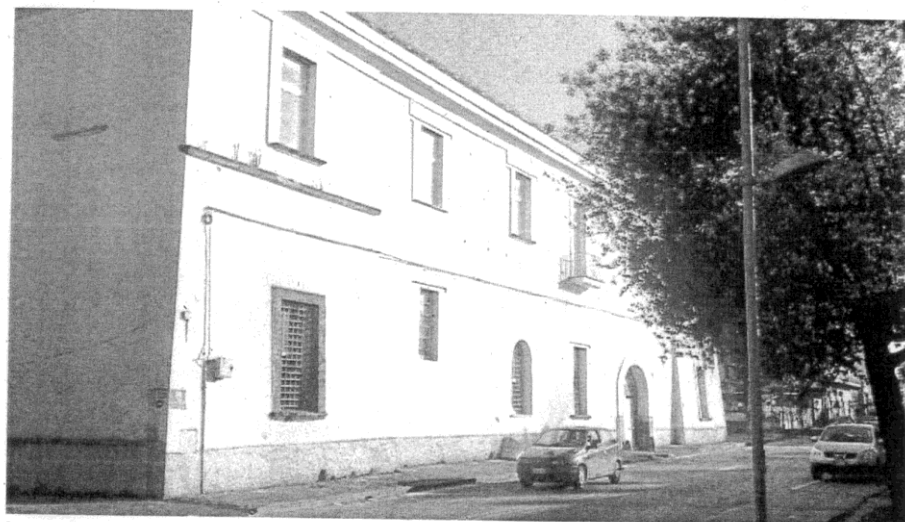
Incompiuta La casa dello studente di Aversa